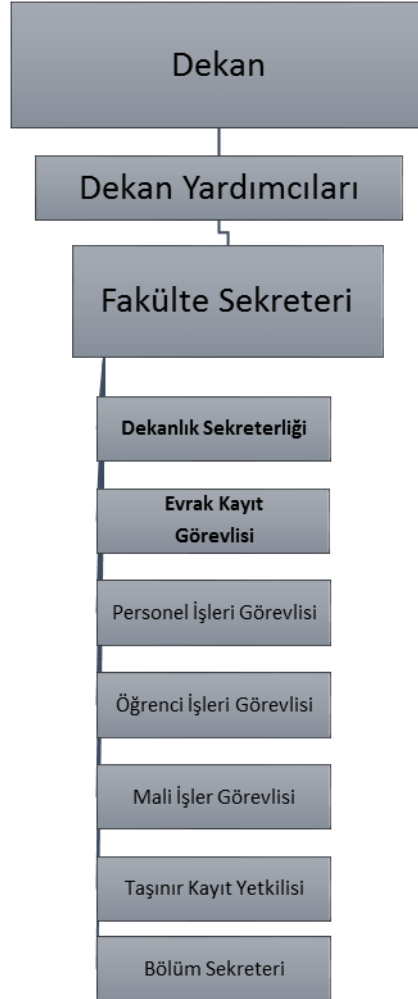
Şekil 2: İdari Teşkilat Şeması